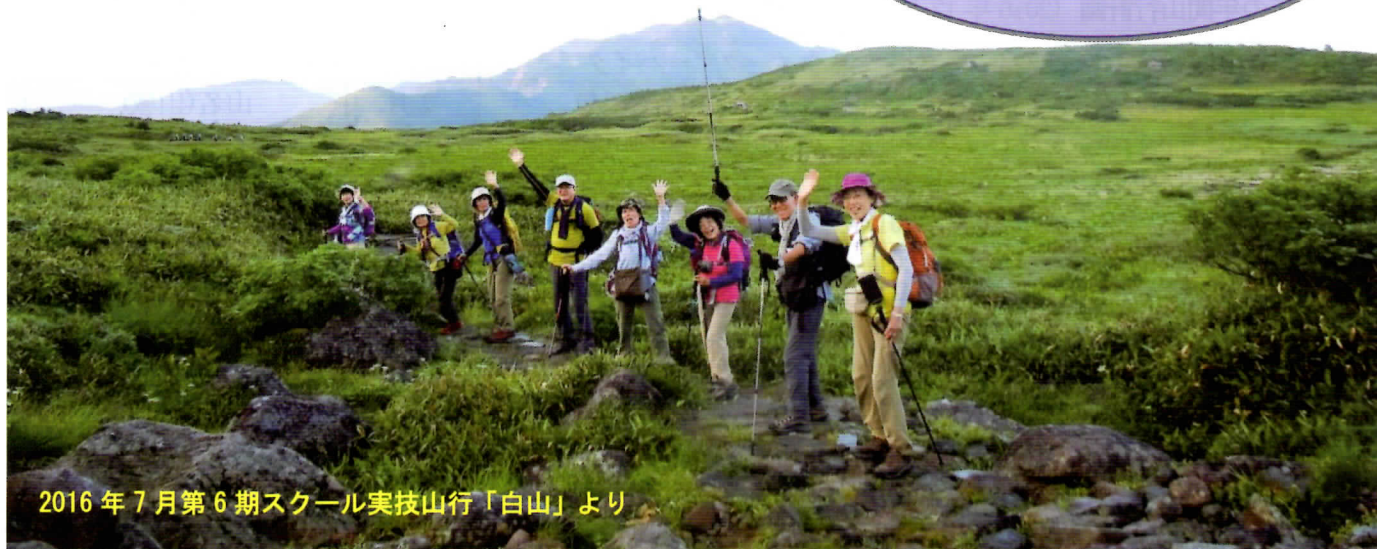
2016年7月第6期スクール実技山行「白山」より